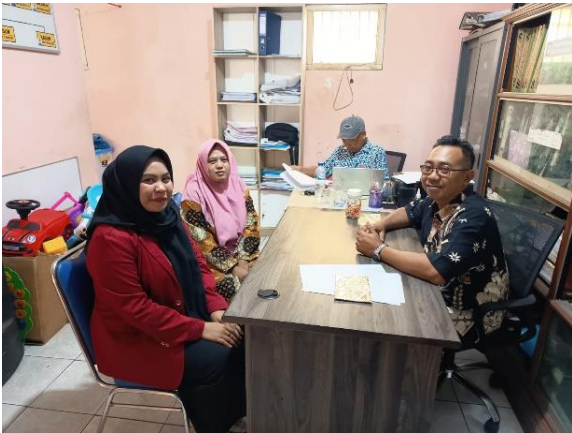
Gambar 3 Wawancara dengan Bendahara Desa dan Sekretaris Desa