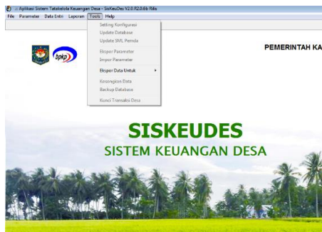
Gambar 1 Tampilan Awal Aplikasi Sistem Keuangan Desa (2024)